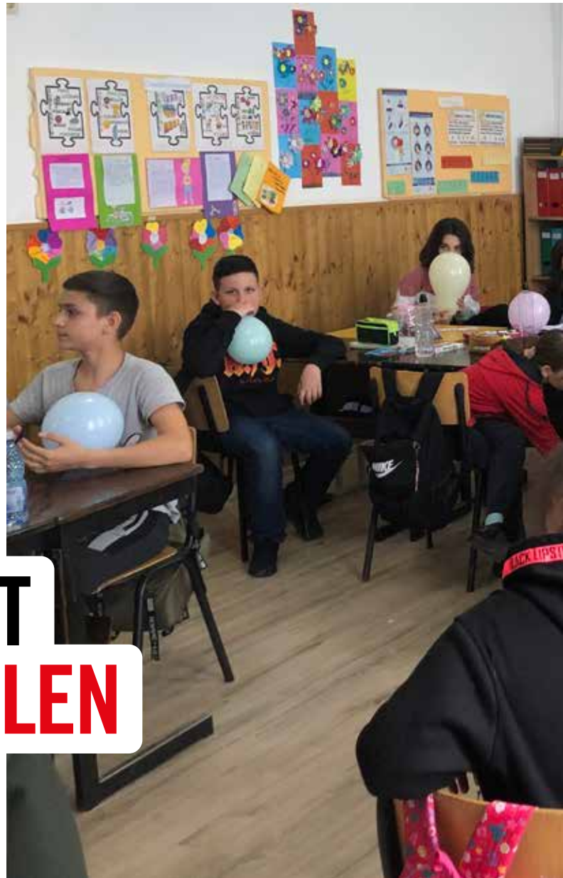
Tidligere i år har flere deltakere fra Redd Barna Norge vært på besøk i Romania, og sosiale tjenester.