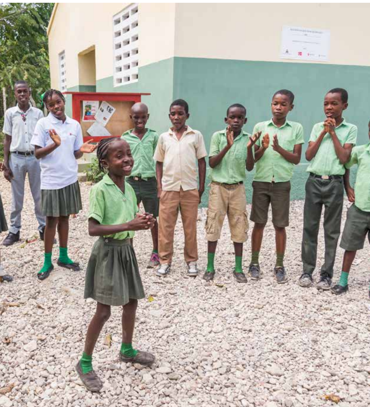
skole som ble gjenoppbygd av Redd Barna i Haiti.