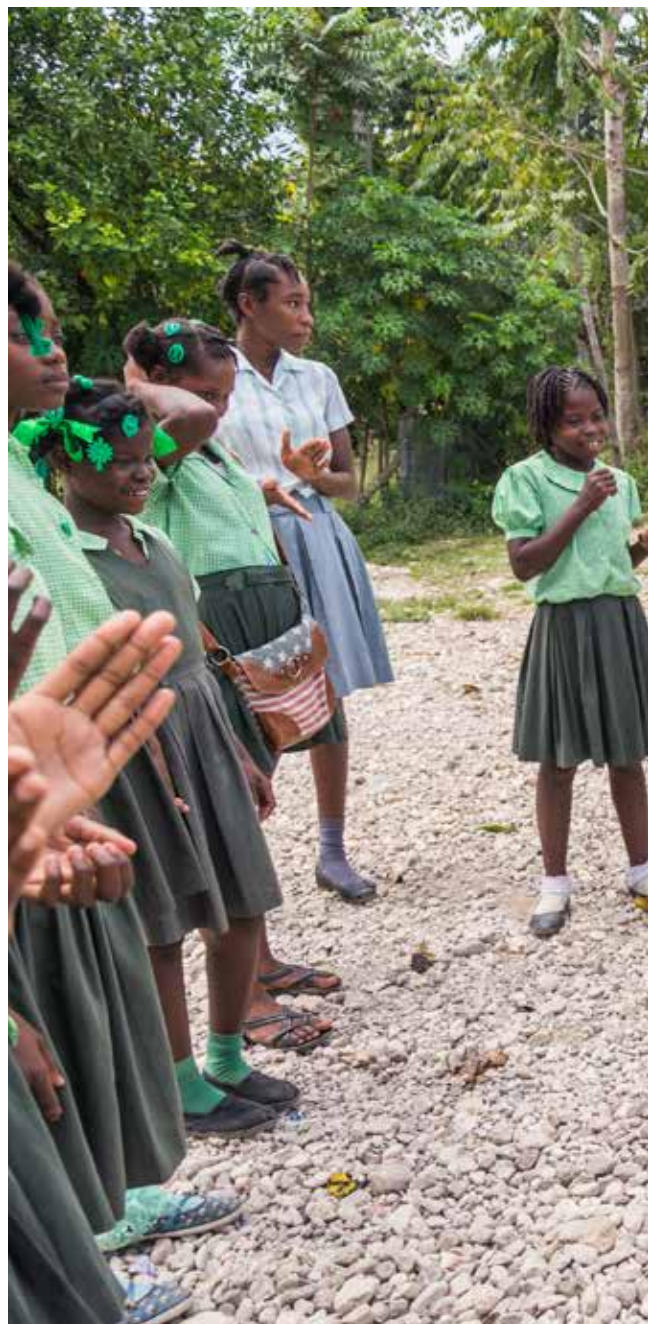
Barn deltar i en animasjonssesjon på Child Friendly Space på en