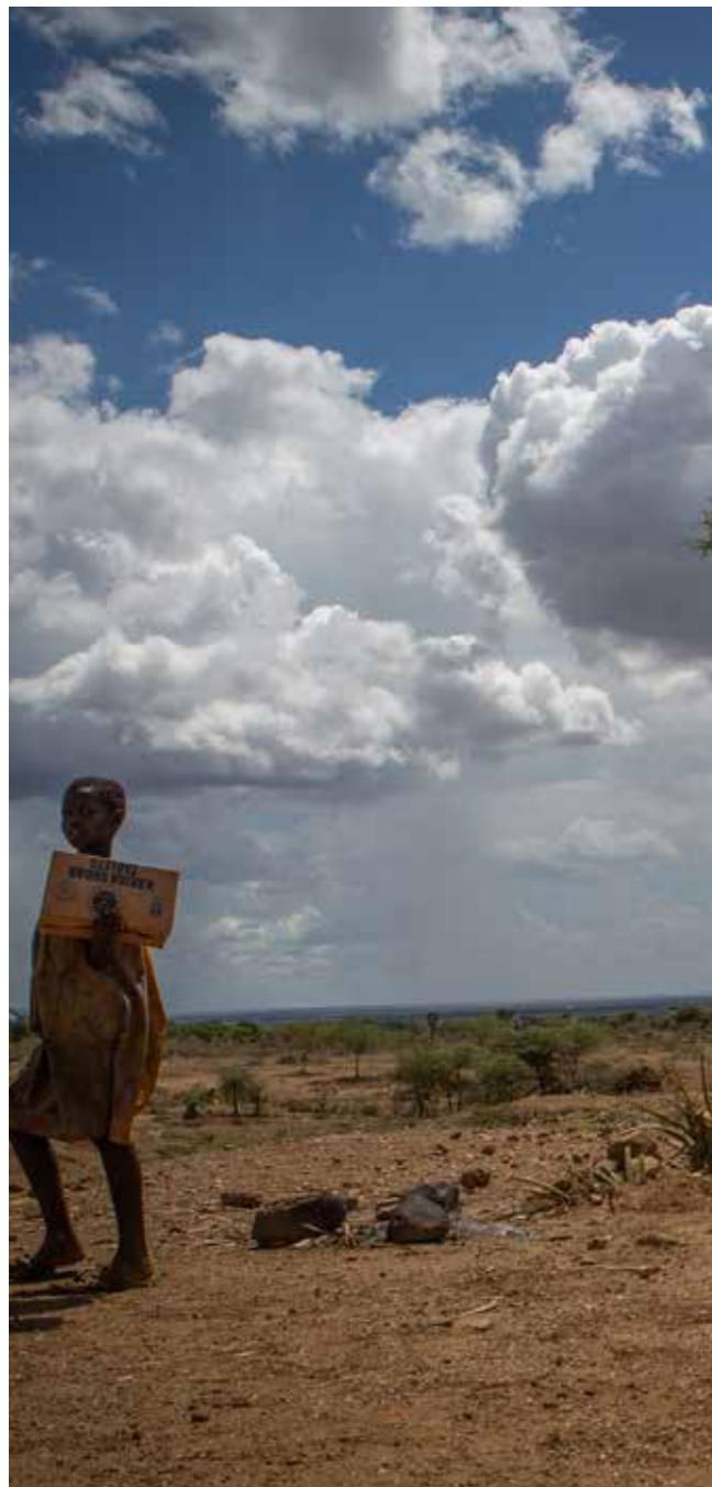
Hver ettermiddag samles gullgraverne i skyggen av et tre.

– Mange barn kommer til meg og forteller grusomme ting hjemmefra. Omsorgssvikt er svært vanlig, og mange barn spiser kun det ene måltidet