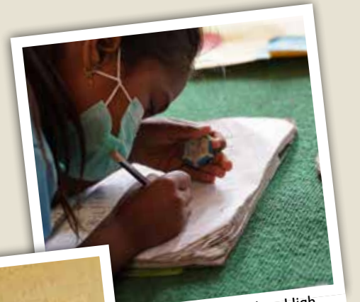
Elevene ved Sri Krishna High School ble hardt rammet under koronapandemien