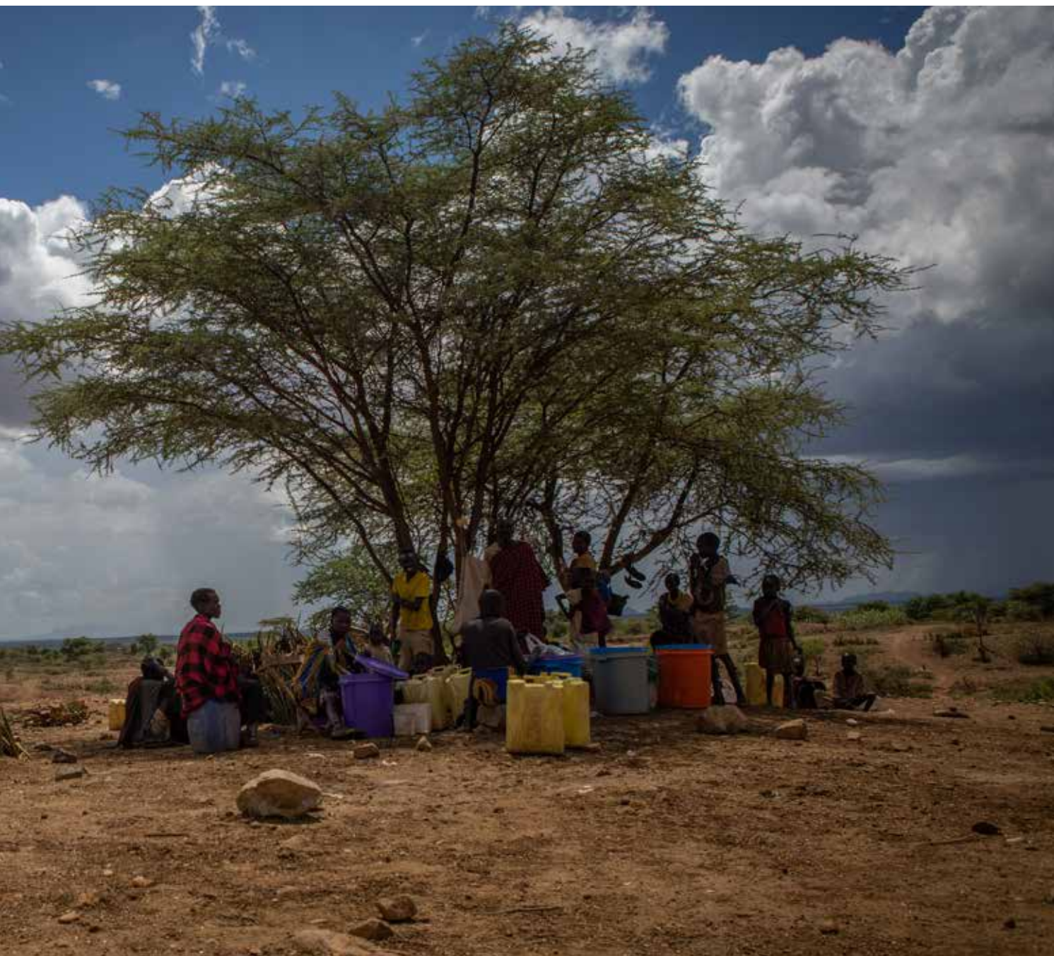
Kjøpere kommer og betaler små summer for gullet. En gjennomsnitts dagslønn for arbeiderne er 2000 shilling (rundt fem kroner).